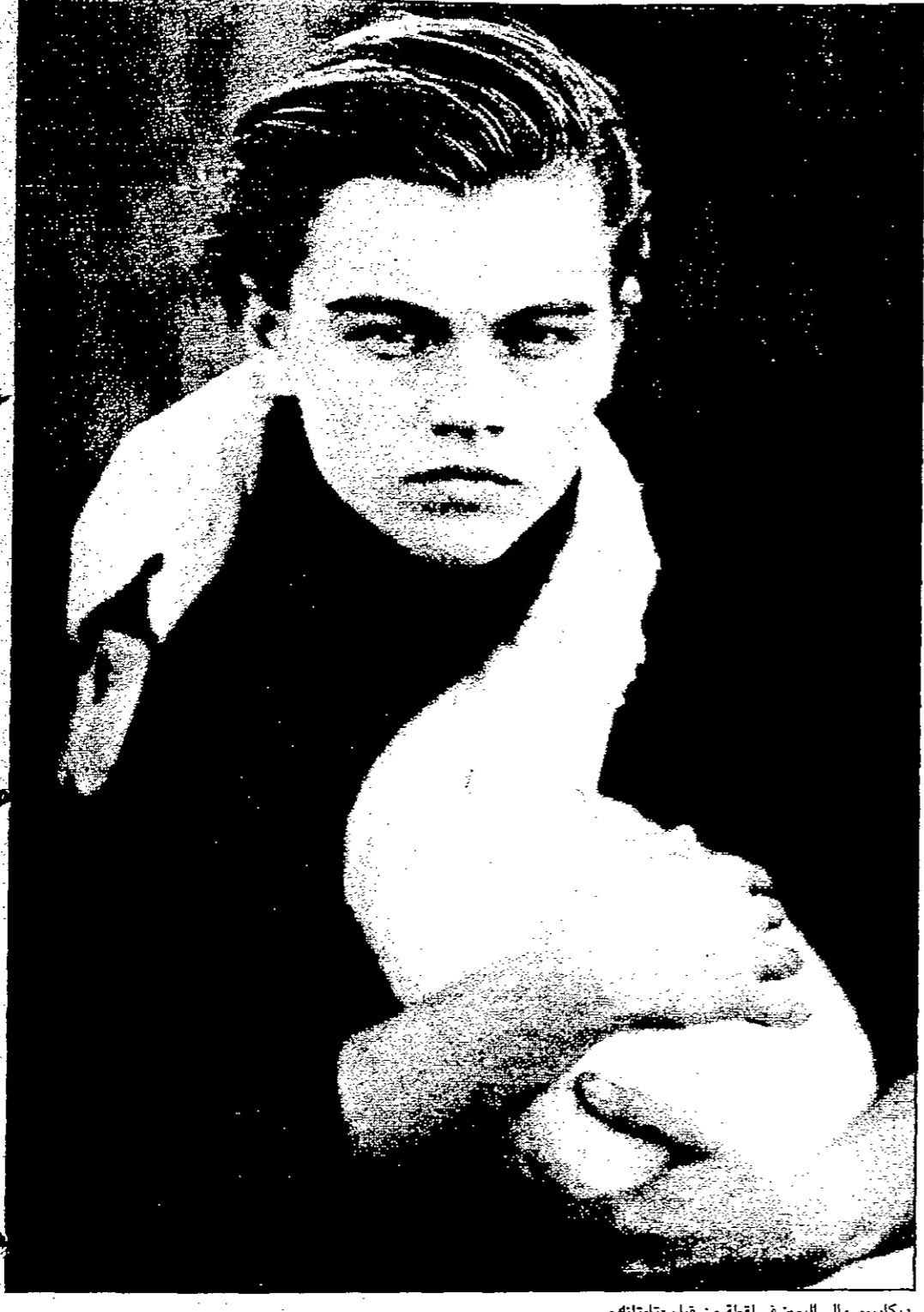
ديكابريو والي المين في لقطة من فيلم «تايتانيك»